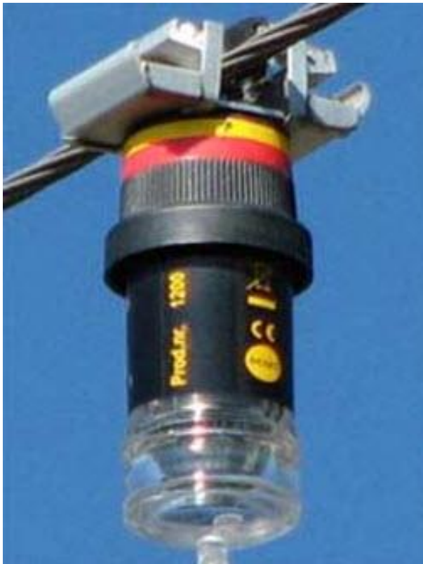
Рисунок 2 – Встановлення індикаторів пошкоджень на проводі ПЛ