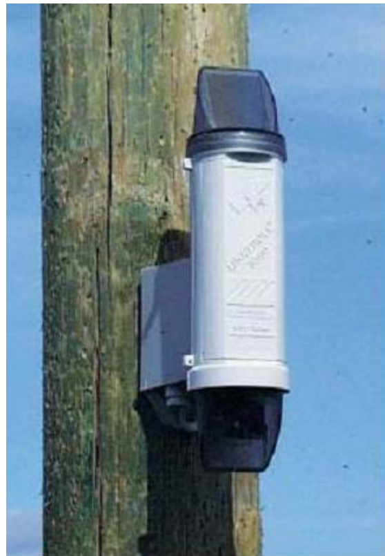
Рисунок 3 – Встановлення індикаторів пошкоджень на опорі ПЛ

Індикатори, встановлені на опорі (рис. 3) дозволяють розрізнити міжфазні КЗ та однофазні пошкодження, враховуючи замикання на землю, незалежно від типу нейтралі. Також перевагою даного типу індикаторів є можливість визначення місця пошкодження відносно місця встановлення індикатора. Принцип визначення напрямку пошкодження полягає в порівнянні векторних значень вимірної напруги та перехідного струму. Коли вектор перехідного струму знаходиться у фазі з вектором напруги, індикатор показує стан «пошкодження перед індикатором», і якщо вектори знаходяться в профазі, то індикатор показує стан «пошкодження за індикатором» [2].