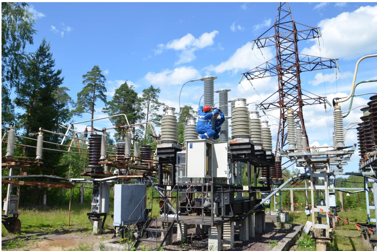
Рисунок 4 – Монтаж вакуумного вимикача зовнішнього встановлення типу ВРС-110 на підстанції 110/10 кВ

Загальний вигляд монтажу вакуумного вимикача зовнішнього встановлення типу ВРС-110 на підстанції 110/10 кВ наведено на рис. 4.