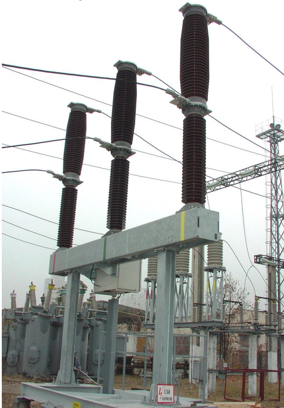
Рисунок 2 – Загальний вигляд елегазового вимикача напругою 110 кВ, встановленого на підстанції 110/35/10 кВ «Лівобережна» ПАТ «Київенерго»

Силові вакуумні вимикачі навантаження напругою до 35 кВ включно експлуатуються в електричних мережах України вже досить тривалий час. Проте в електричних мережах напругою 110 кВ із сучасних типів вимикачів найпоширенішими є саме елегазові. Загальний вигляд елегазового вимикача навантаження, встановленого на підстанції 110/35/10 кВ «Лівобережна» ПАТ «Київенерго» наведено на рис. 2.