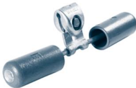
Рисунок 1 – Загальний вигляд віброгасників ПЛ 35-330 кВ

На лініях напругою від 35 до 330 кВ встановлюють віброгасники, виконані у вигляді двох вантажів, підвішених на сталевому тросі (рис. 1).