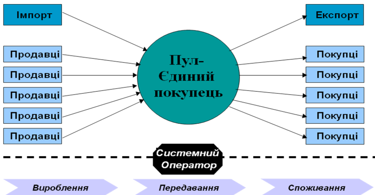
Рисунок 1 – Схема організації ринку електричної енергії за моделлю Пула

XX століття була модель Пулу електричної енергії (модель Єдиного покупця), схему якої наведено на рис. 1.