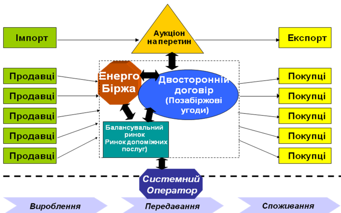
Рисунок 3 – Схема організації «лібералізованого» ринку електричної енергії

Саме за цією схемою працює ринок електричної енергії України і сьогодні. Проте чинним Законом України «Про засади функціонування ринку електричної енергії України» [1] передбачено реформування існуючої моделі і запровадження так званого «лібералізованого» ринку електричної енергії, схему якого наведено на рис. 3.